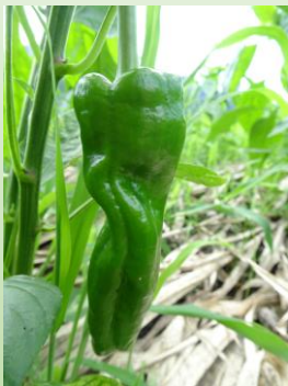
なんばん第1号。 12cmほどだが 収穫はまだ先。