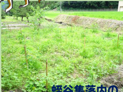
蛭谷集落内のトロロアオイ畑