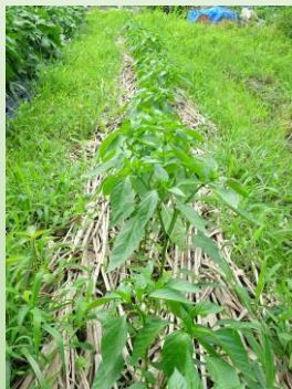
マルチは使わず、 ヨシで昔ながらの 雑草除け

5月中旬、蛭谷和紙の原料の一つトロロアオイ畑の余った畝で、蛭谷でしか育たないといわれている「蛭谷なんばん」の定植も同時に行いました。集落の方に苗をいただき、約100本ほどを植え付け。定植した苗がネキリムシにやられながらも、めでたくなんばん第1号が実る！ 1本から赤・黄・緑のなんばんが約30個の実るため、3000個の収穫が見込めるはず！ 蛭谷なんばんは、煮てよし、焼いてよし、揚げてよしの万能野菜！皆さんにこのなんばんを知っていただくために、今夏は頑張つてなんばん収穫するぞ〜！