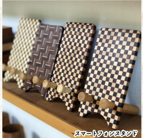
スマートフォンスタンド