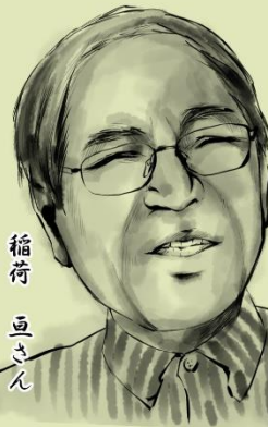
稲荷 亘さん ※イメージとなります