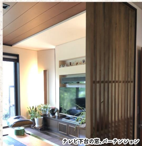
テレビ下台の窓、パーテーション