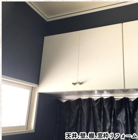
天井、壁、棚、窓枠リフォーム