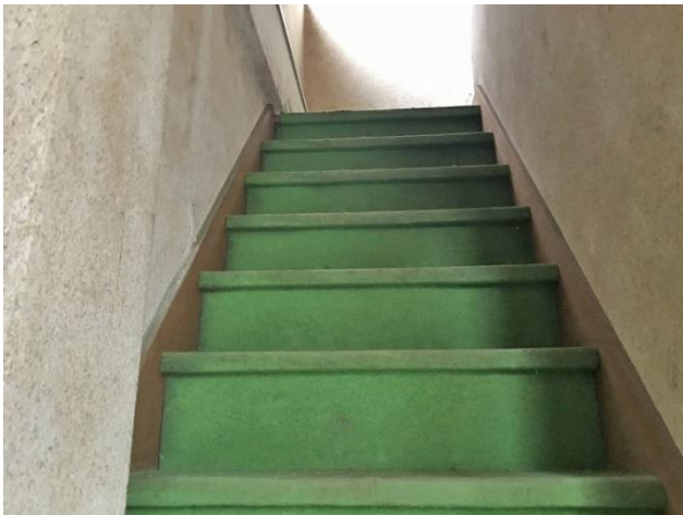
1階 階段（1階より撮影）