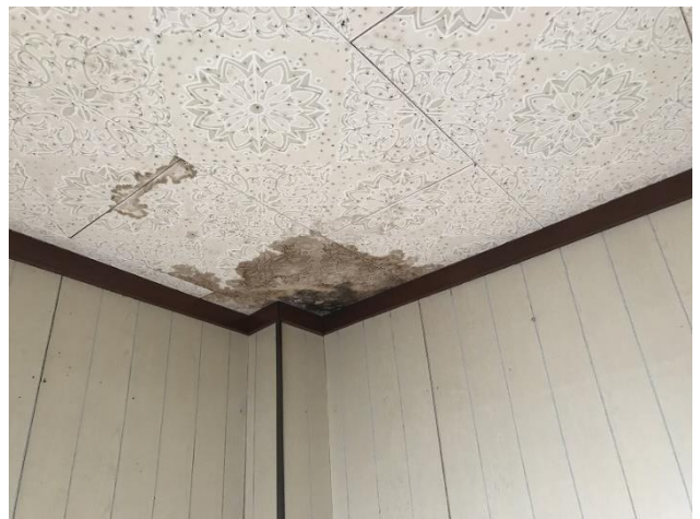
2階 洋室4帖（雨漏り跡2）