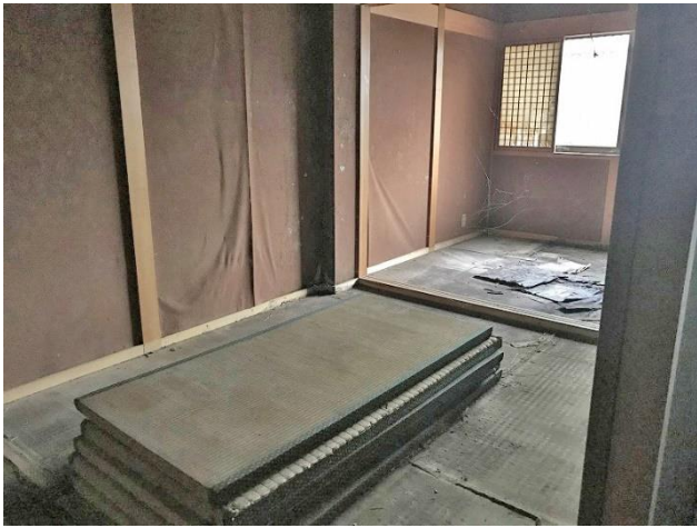
1階 店舗お座敷部分