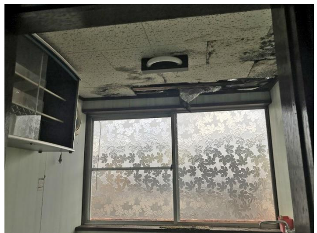
3階 台所天井部分（雨漏り跡）