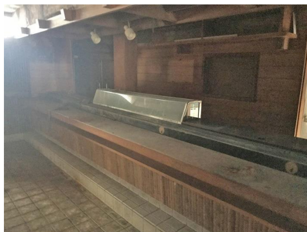
1階 店舗カウンター部分