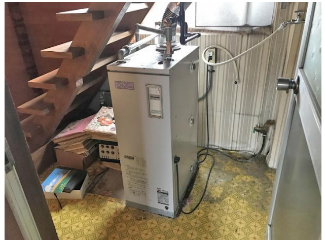
2階 灯油ボイラー・3階への階段