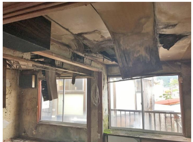
2階 和室15帖（雨漏り跡）