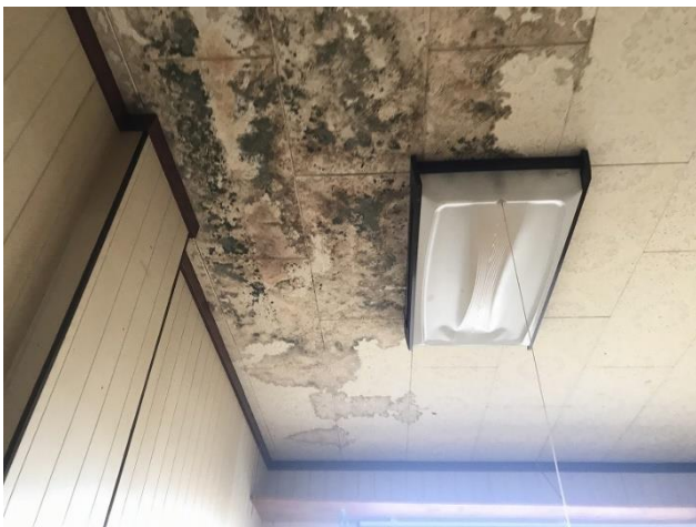
2階 洋室4帖（雨漏り跡1）