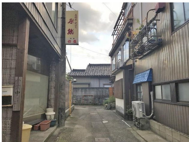
建物前面の接道状況