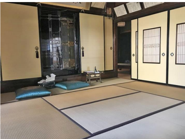
1階 和室 8帖