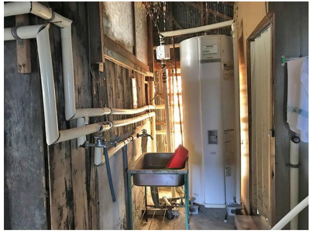
1階 風呂場入口（別角度）・電気温水器