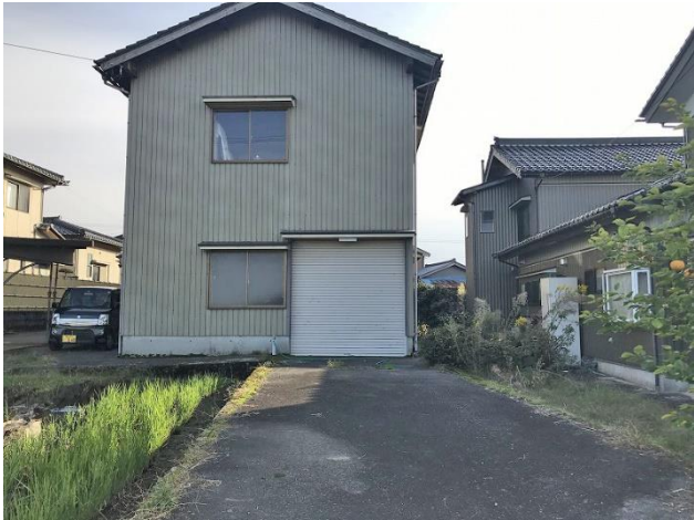
納屋 (別角度より撮影)・私道