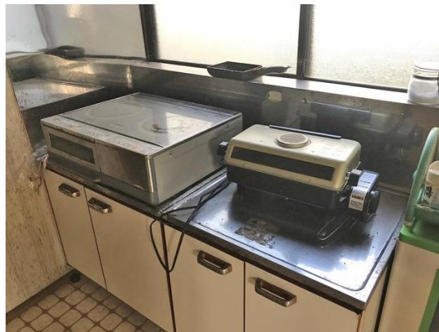
1階 台所(IHクッキングヒーター)