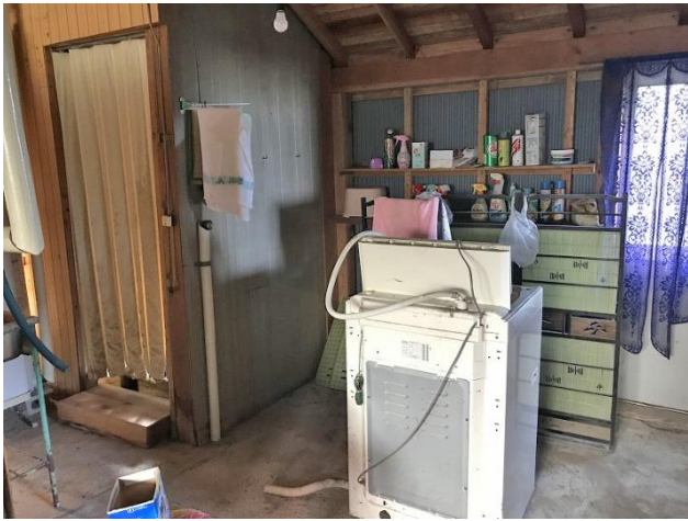
1階 風呂場入口・洗濯機置き場