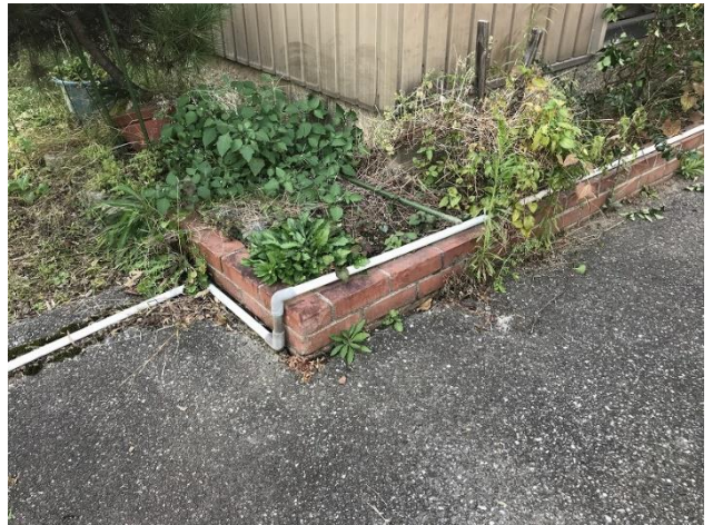
母屋外側の融雪装置