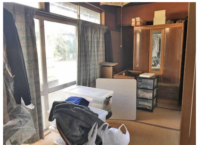
1階 和室 5帖