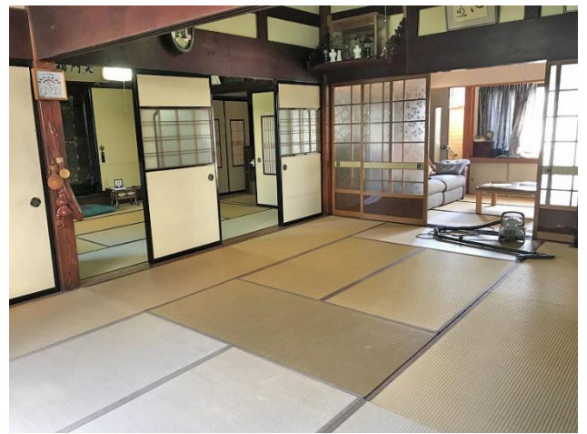
1階 和室 12帖