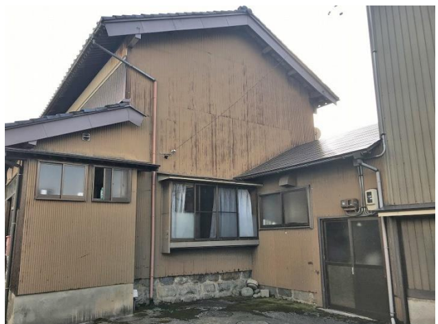
納屋と母屋の接続部分