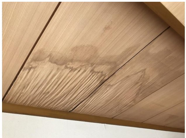
2階 雨漏り跡 (屋根未修繕)