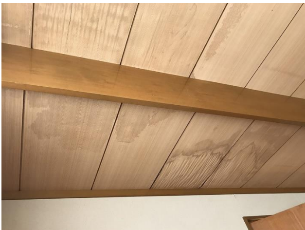
2階 雨漏り跡 (屋根未修繕)