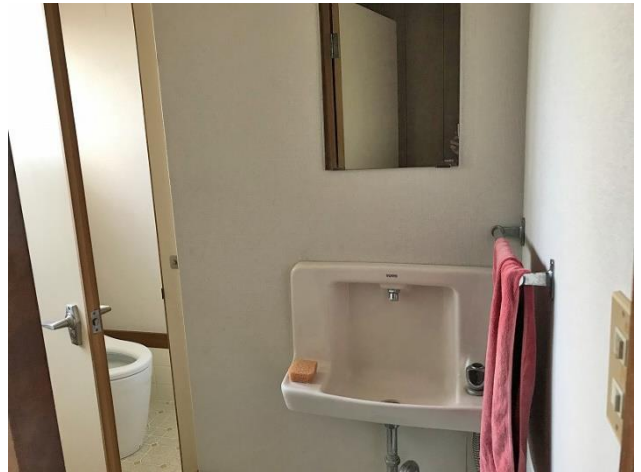
1階 トイレ前手洗い場