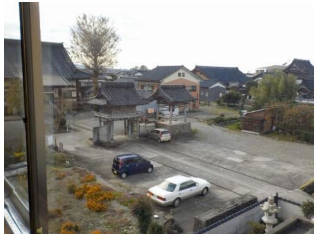
3階 廊下からの眺め