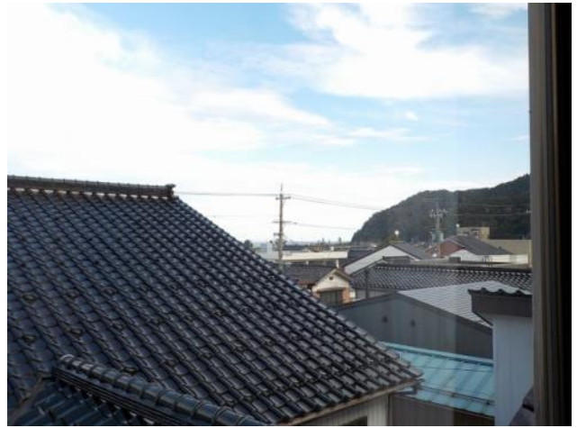
3階 和室からの眺め