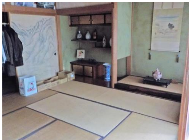
2階 和室10畳 (別角度)