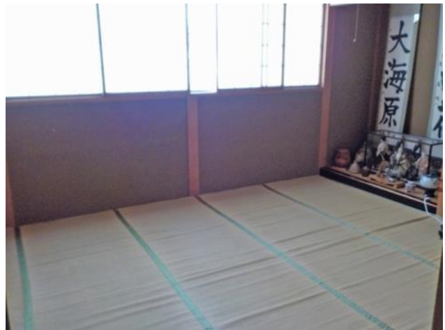
2階 和室12畳 (別角度)