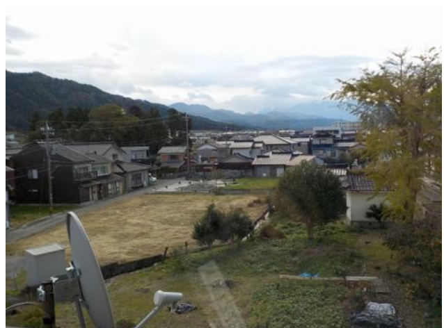
3階 洋室からの眺め