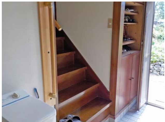
1階 居住部への階段