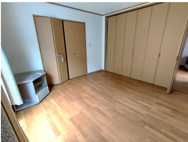
2階 洋室 8帖