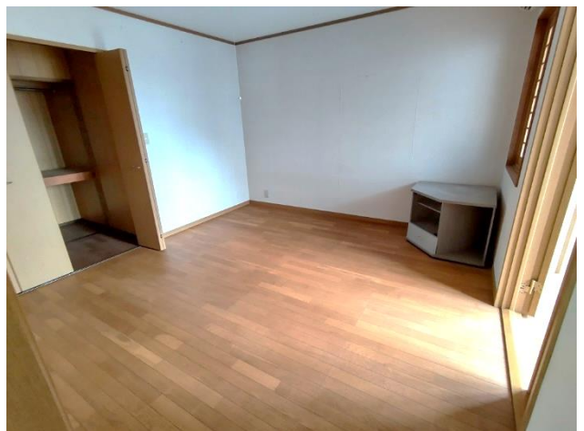
2階 洋室 8帖