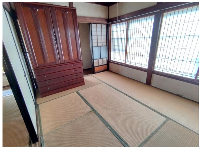
2階 和室 6帖