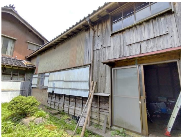
外観（建物西側）、物置への入り口