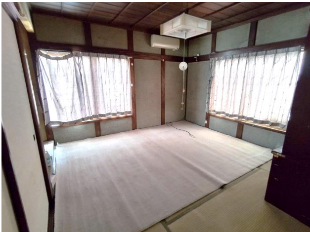
1階 和室 8帖