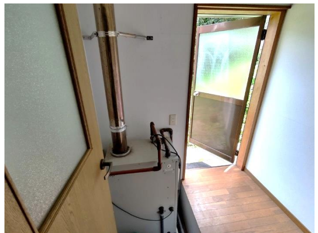
1階 ボイラー置き場、勝手口