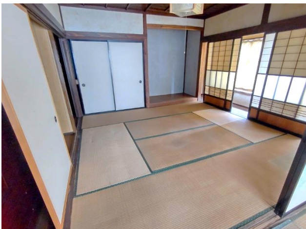
2階 和室 8帖