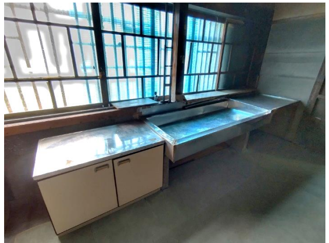
1階 台所 (シンク)