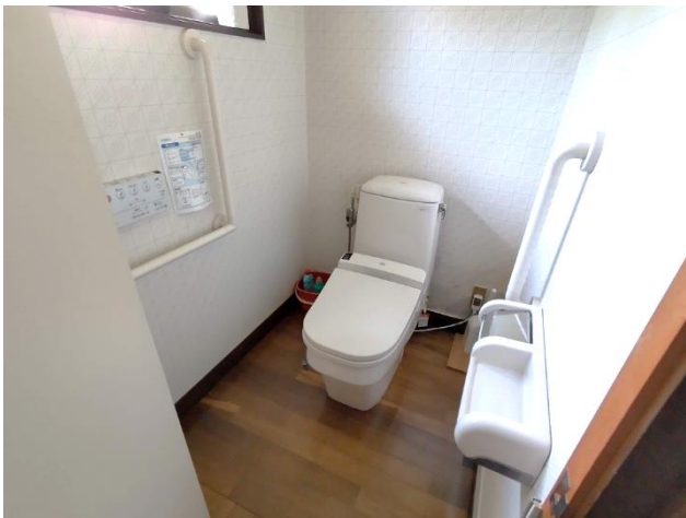
1階 トイレ (洋式)