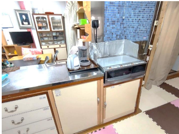
1階 台所 (IH クッキングヒーター)