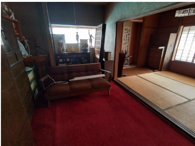
2階 和室6帖手前の板間