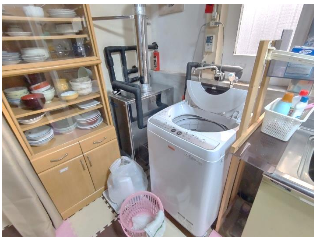
1階 台所 (灯油ボイラー・洗濯機置き場)