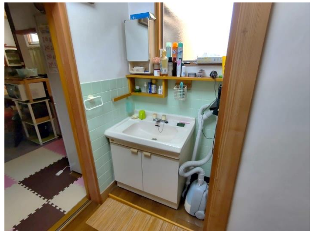
1階 台所横の洗面所