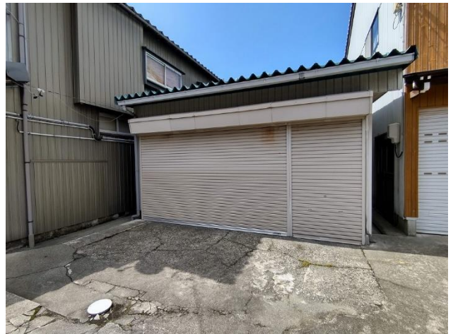
ガレージ（母屋東側）