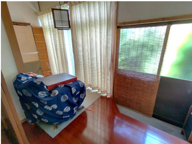
1階 縁側、庭へのドア