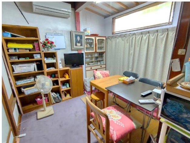
1階 台所 (食事スペース)