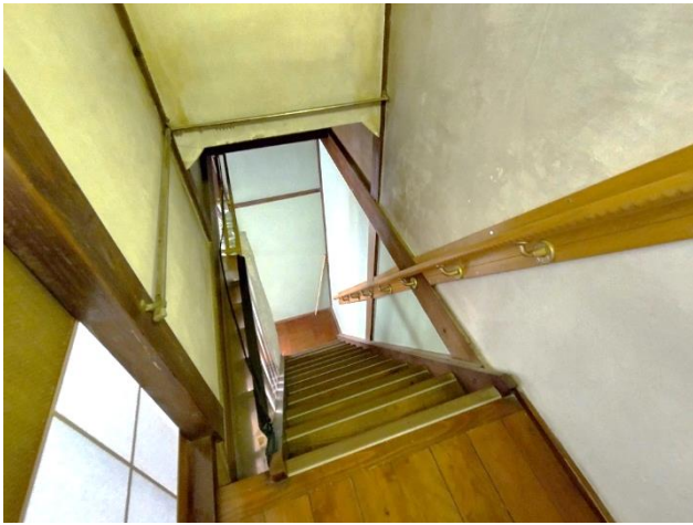
2階から見下ろした階段