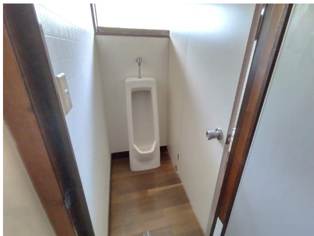
1階 トイレ (男性用)