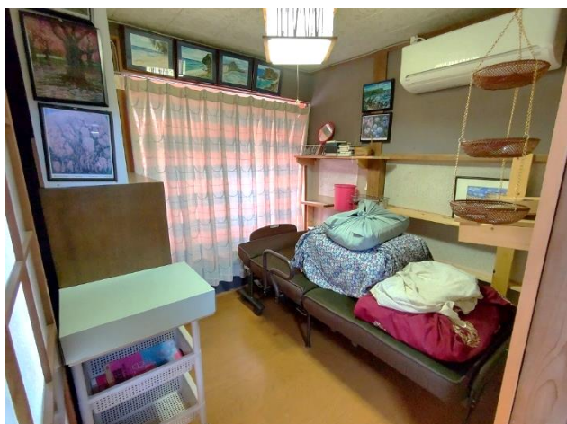
1階 洋室 4帖