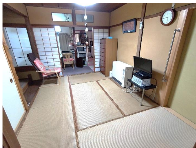
1階 和室 6帖