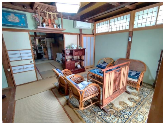
1階 居間 6帖