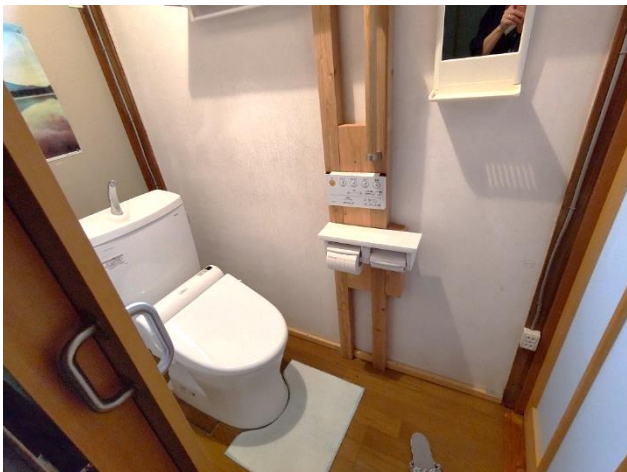
1階 和室6帖隣接の洋式トイレ