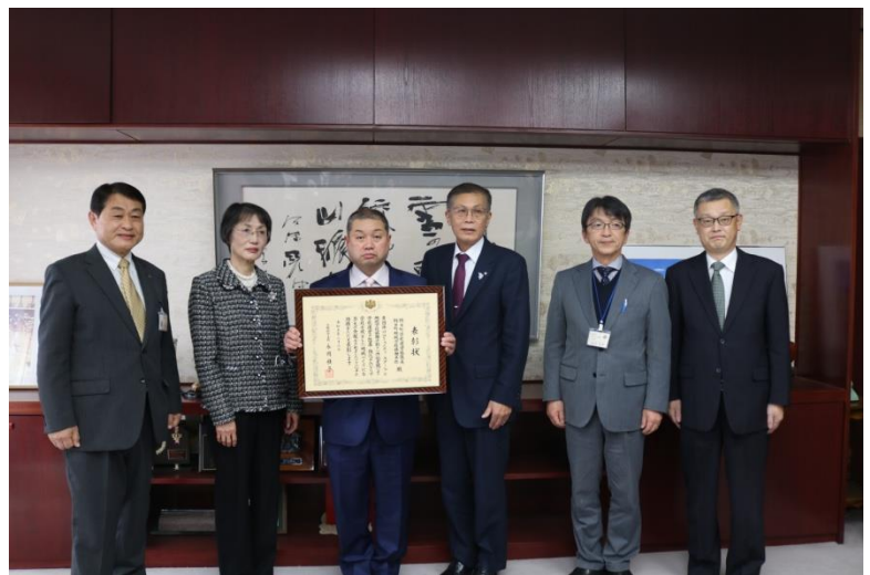
〈2/7、笹原町長への報告会〉

具体的な取組として、朝日町では、県内自治体に先駆け、退職教員による放課後学習指導や外部人材による部活動指導など、学校運営に地域住民が関わる仕組みを取り入れてきました。本年度は7つの運動部と吹奏楽部で地域移行を行っています。登下校の管理や「14歳の挑戦」など一部行事の連絡調整も住民が主体的に担い、教員は授業や面談など本業に専念できるようになりました。また、小中学校の下校時刻も繰り上げし、教員の長時間勤務解消につなげました。保小中一貫教育も本年度よりスタートするとともに、町独自の教科「ふるさと科」を設け、郷土愛の育成に取り組みました。