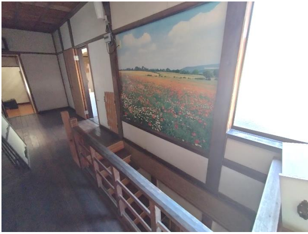
2階 階段を上った部分