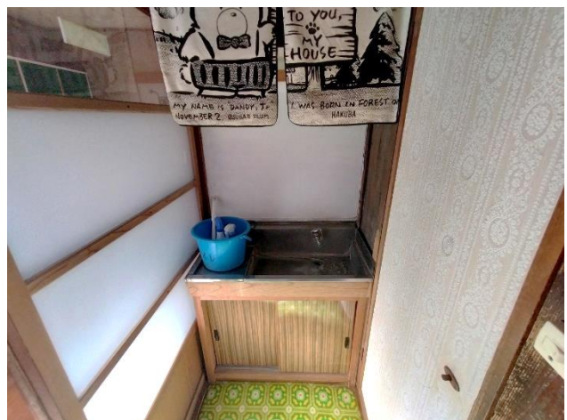
1階 トイレ前手洗い