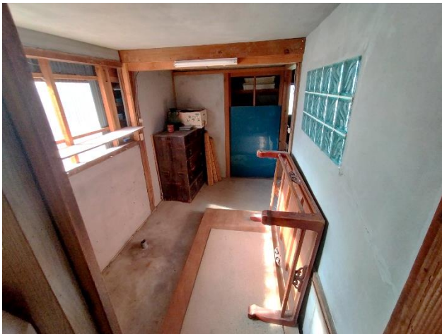
1階 納屋への接続口