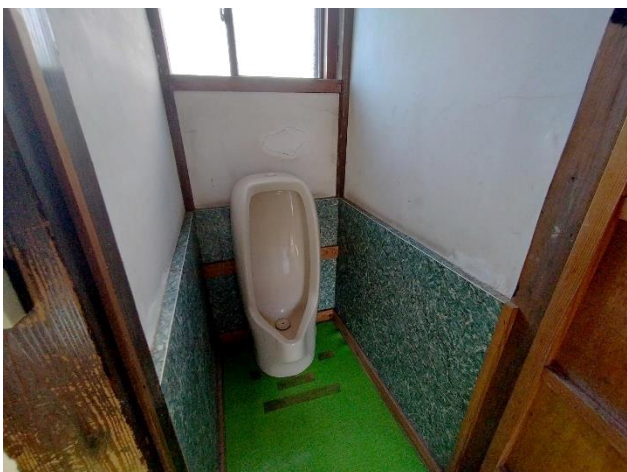
1階 トイレ (男性用)