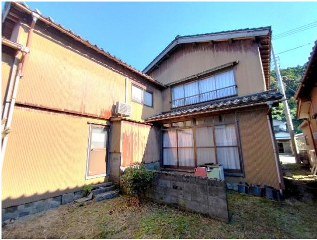
母屋外観（南東向きに撮影）