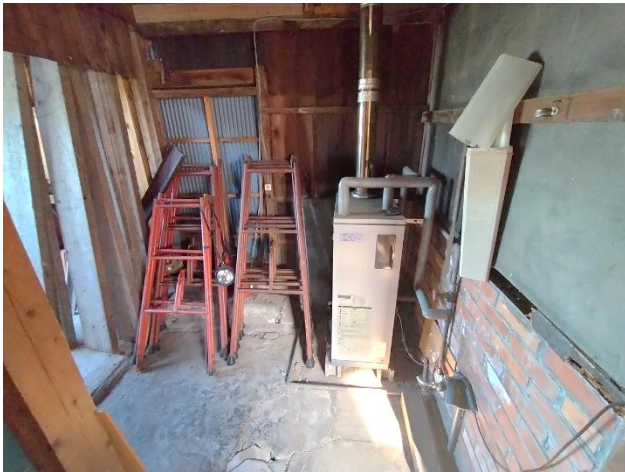
納屋 (ボイラー置き場)