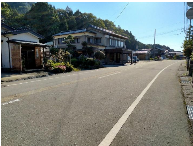
接道状況（西向きに撮影）