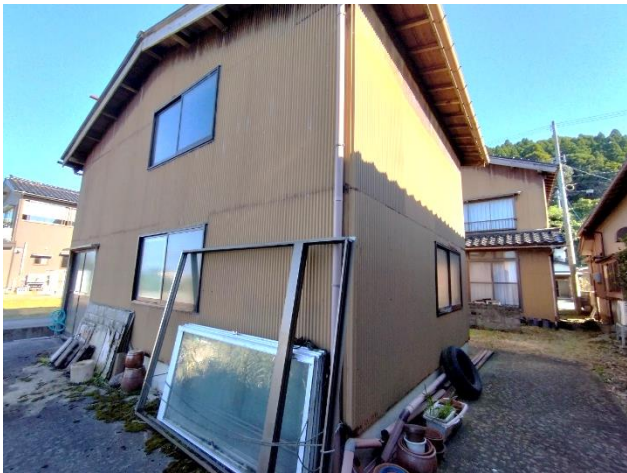
納屋外観（南東向きに撮影）