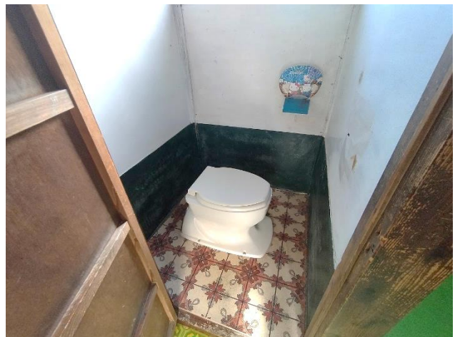
1階 トイレ (洋式)