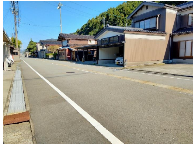
接道状況（東向きに撮影）