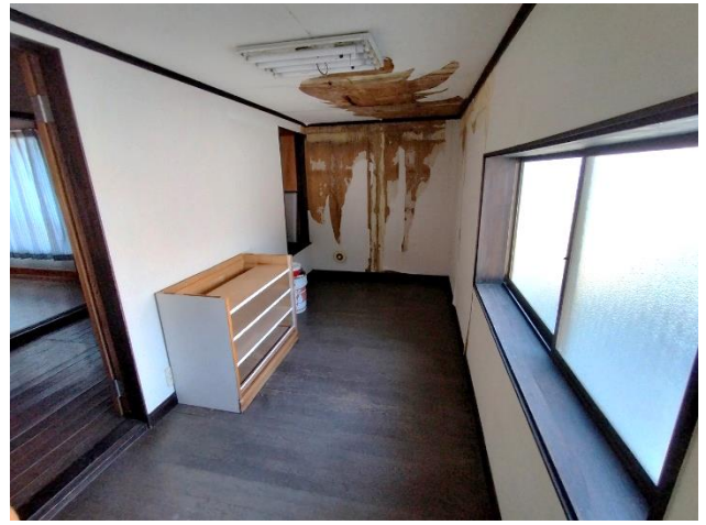
2階 洋室5帖 (雨漏り跡あり)