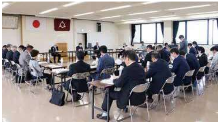
朝日町総合計画・総合戦略検証委員会