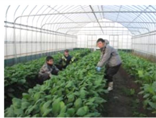
あさひ農学舎のハウスでカブ栽培