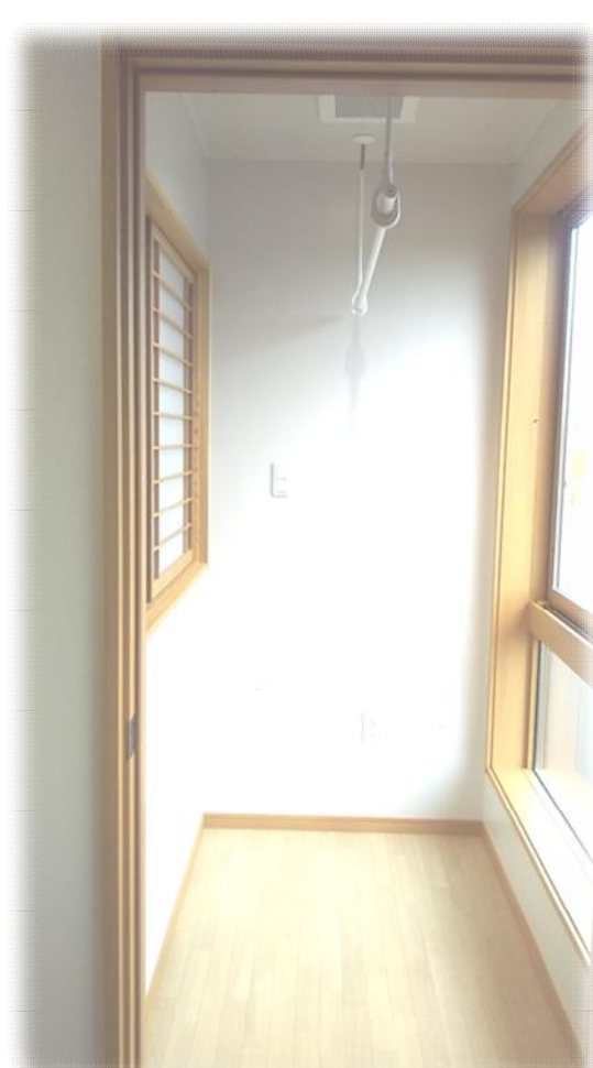
洗濯物干しスペース