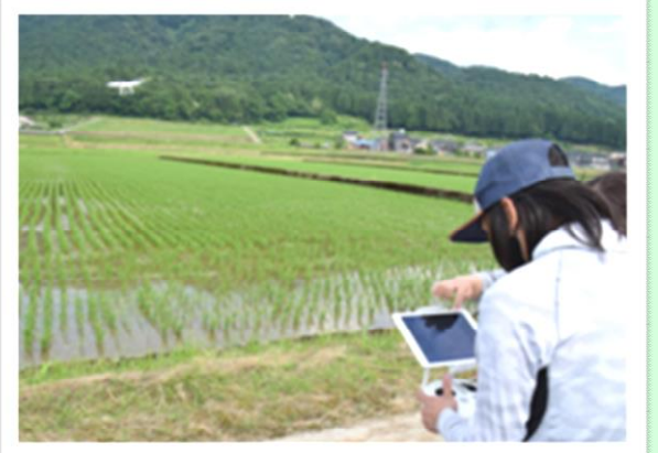
ドローンを使った研修