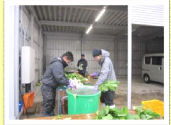
出荷のための準備