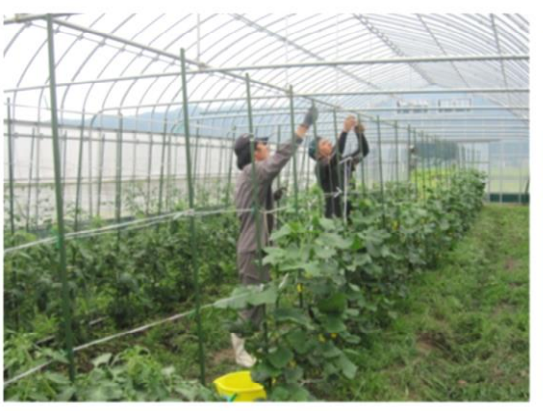
あさひ農学舎ハウス 夏野菜栽培