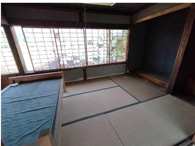
2階 和室 6帖