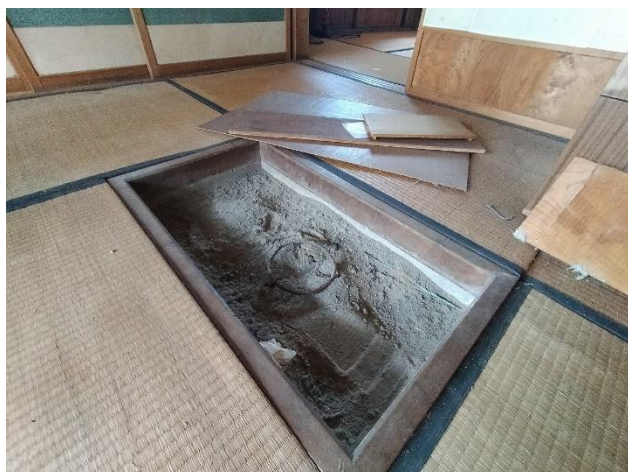
1階 和室 4.5帖 (囲炉裏部分)