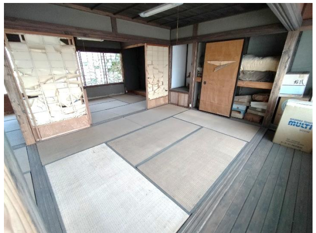
2階 和室 6帖