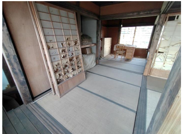
2階 納戸 3帖