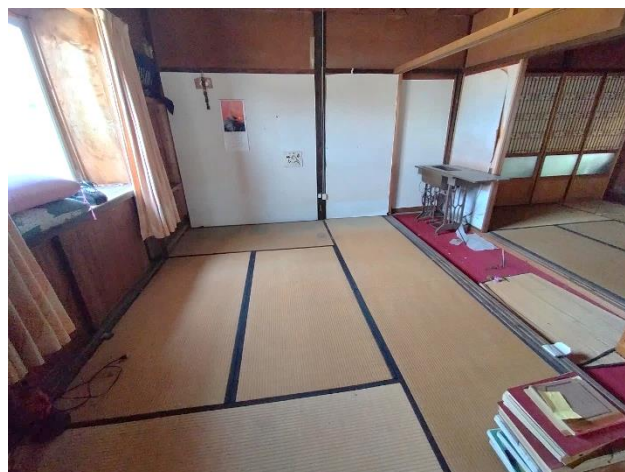
1階 和室 6帖