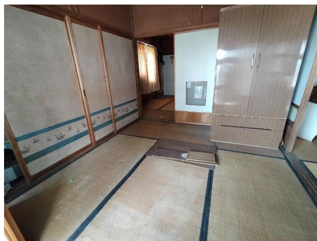
1階 和室 4.5帖