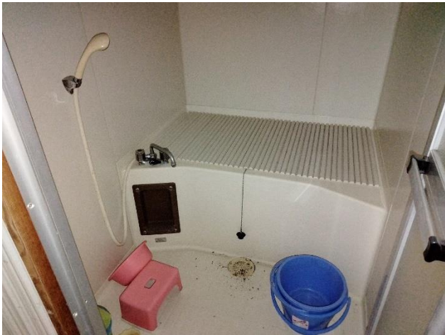
1階増築部分 風呂場 (脱衣スペースはなし)