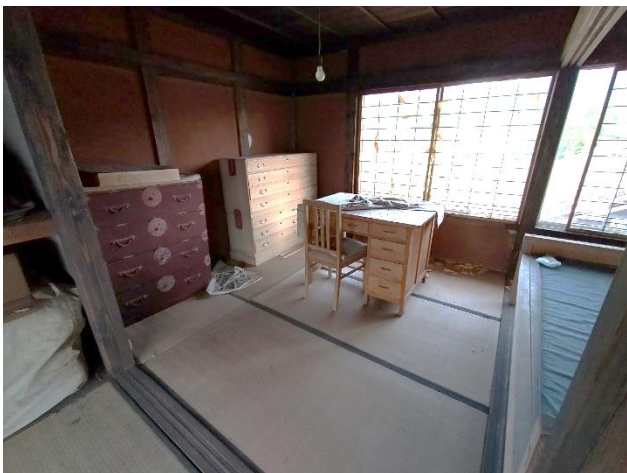
2階 和室 4. 5帖