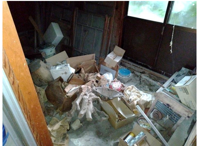
1階増築部分 物置き