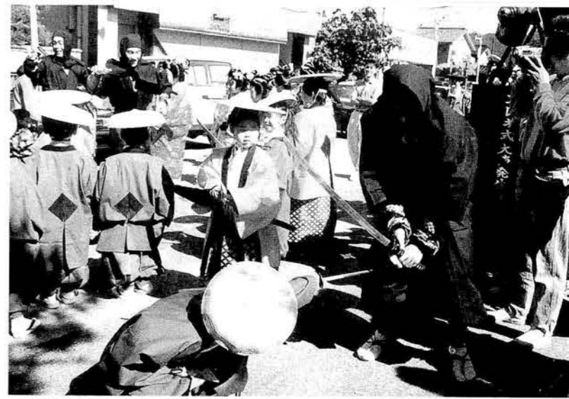
▲忍者も出現。大名行列劇場も行われました。