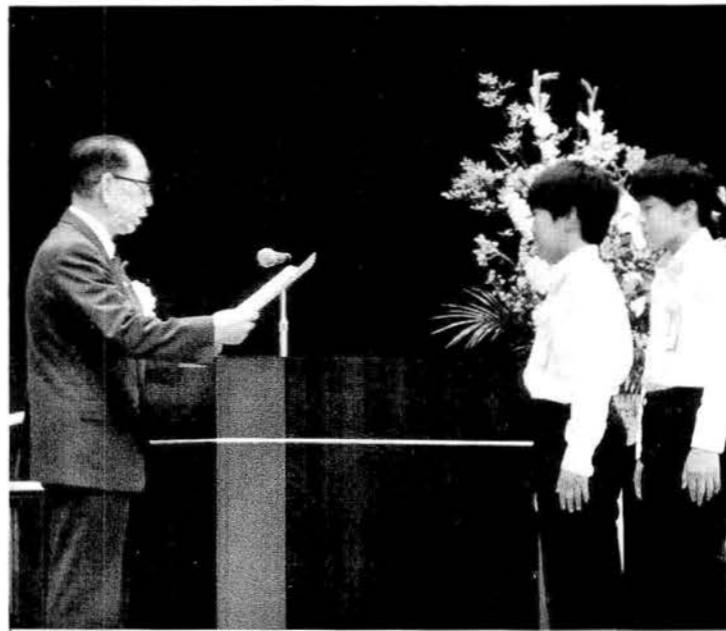
朝日町社会福祉協議会の共同募金運動50周年記念大会