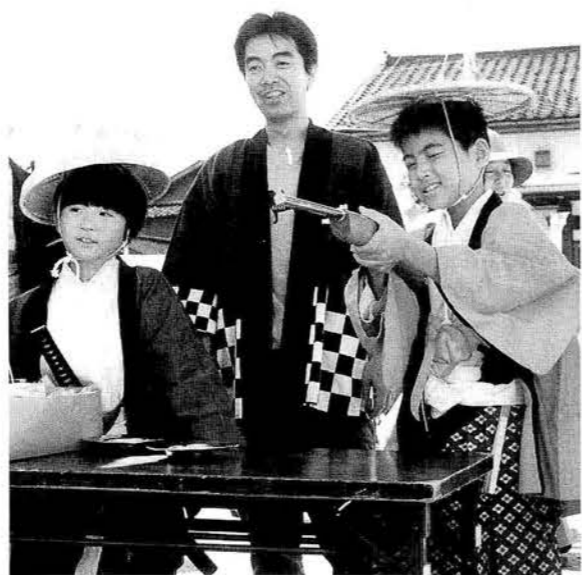
▲射的や輪なげといったゲームコーナーもあり、参加した子供たちも熱中していました。