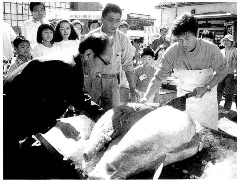
▲75キロのマグロを解体した即売会。あっという間に売り切れました。