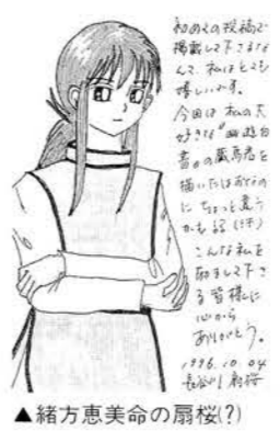
▲緒方恵美命の扇桜(?)