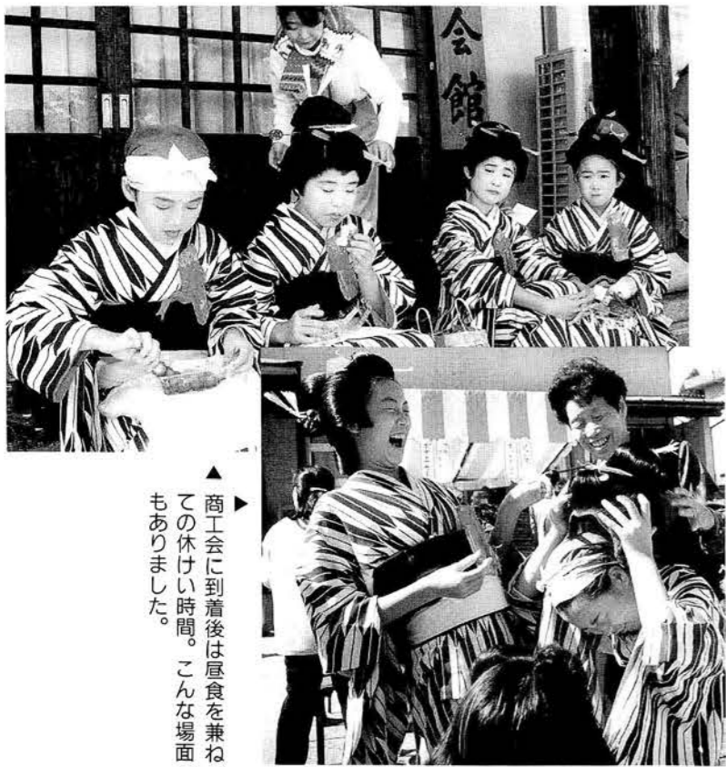
▲商工会に到着後は昼食を兼ねての休けい時間。こんな場面もありました。

13日には、マグロ一匹の解体即売会やミニ4駆大会などが開催。集まった大勢の皆さんは2日間にわたり、楽しい一時を過ごしました。