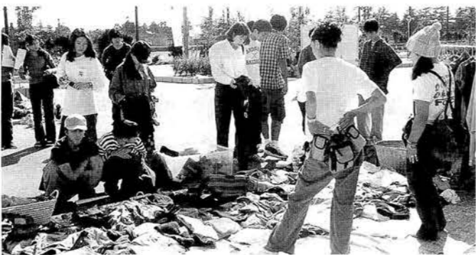
田樹利亜のライブがあり、CMソングなど17曲を熱唱。観客は総立ちとなり、ファイナルを迎えました。 ◀若者に人気の古着などフリーマーケットも大盛況。