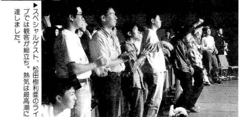
▶スペシャルゲスト、松田樹利亜のライブでは観客が総立ち。熱気は最高潮に達しました。