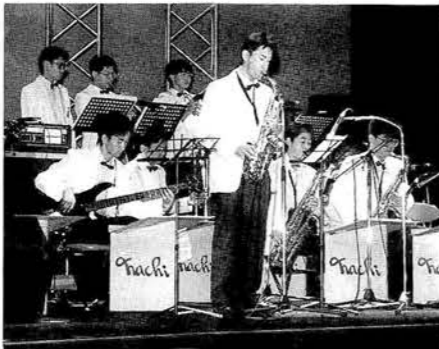
◀ジャズからロックまでアマチュアバンドが様々な音楽を披露。約500人の観客を前に、熱いライブを繰り広げました。

第11回国民文化祭とやま'96「ヤングミュージックフェスティバル in あさひ」が10月5日、朝日町文化体育センター・サンリーナを舞台に行われました。メインステージには地元朝日町をはじめ熊本、埼玉県など14のアマチュアバンドが熱いライブを展開。訪れた多くの若者は、ジャズからロックまで幅広い音楽を満喫しました。 また、サンリーナ周辺でもアマチュアバンドによるステージのほか、フリーマーケットや中古CDの販売を開催。古着など掘り出し物探しに熱中している姿も見られました。 夜にはスペシャルゲスト、松