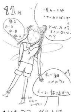
▲いちごヨーグルト(13)