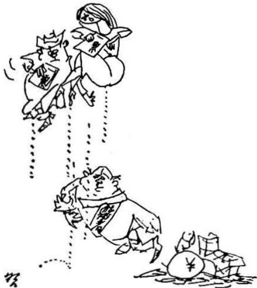
ハインシュウヤ義理じや差ないこの一票