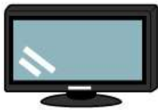
●テレビ (ブラウン管、液晶、プラズマ)

平成13年4月1日から家電リサイクル法の施行により、テレビ・冷蔵庫（冷凍庫）・洗濯機（乾燥機）・エアコンの家電4品目は、再商品化（リサイクル）しています。過去に購入された家電小売店や新たに購入される家電小売店でのお引取りをお願いします。ごみステーションに出されても回収しませんのでご注意ください。