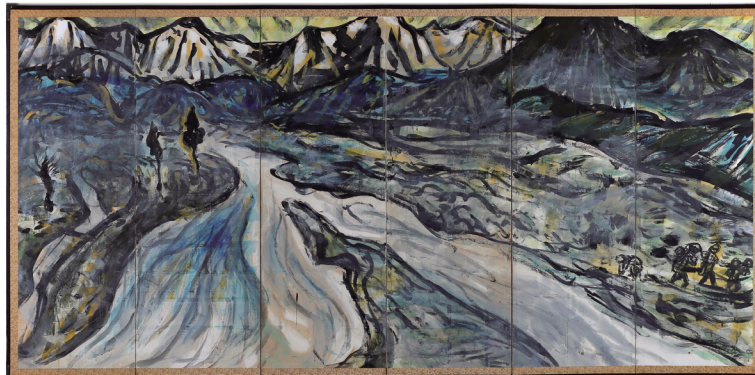
山河経文 朝日岳 岩崎巴人(六曲一双屏風 左隻)朝日町蔵