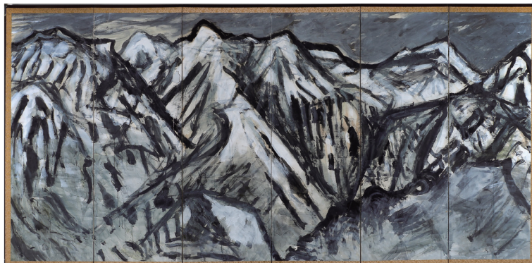
山河経文 白馬岳 岩崎巴人(六曲一双屏風 右隻)朝日町蔵