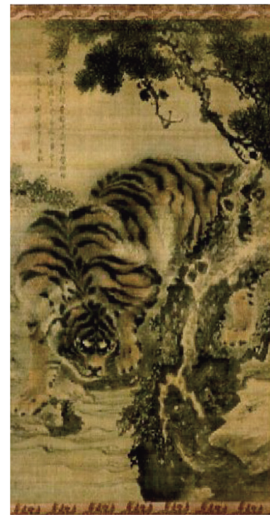
窠下猛虎図 岸駒(軸装)朝日町蔵