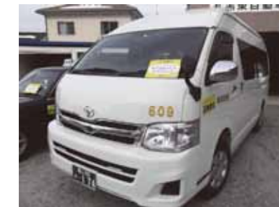
北陸新幹線とのアクセスに便利です。