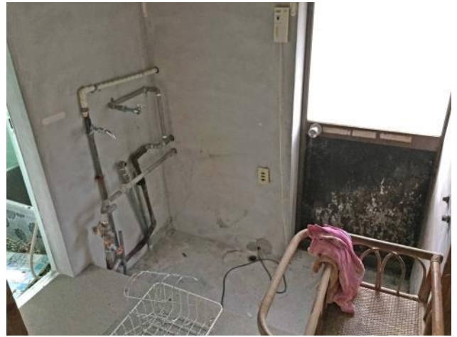
1階 脱衣所、洗濯機置場、勝手口