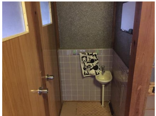
1階 トイレ手洗い場