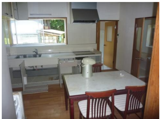
1階 台所（別角度から）