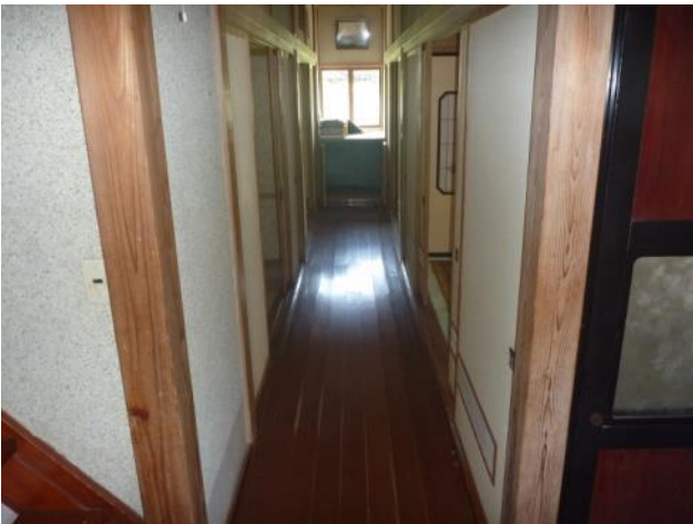
1階 廊下 (南側)