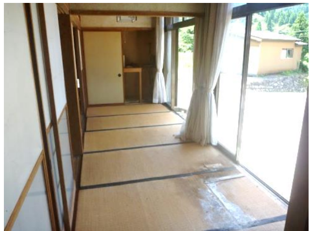
1階 縁側 (西向き)