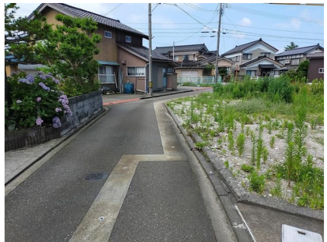
接道状況（敷地南側）